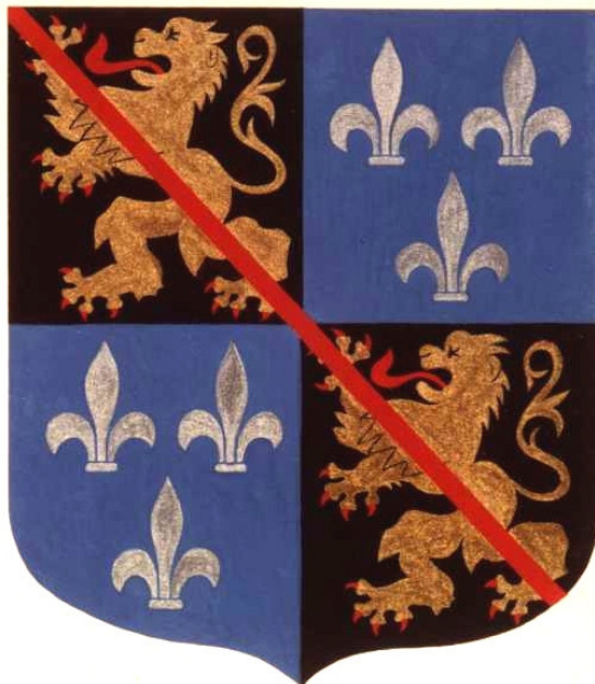
Ätten Ronges vapensköld

Den belgiska ätten Ronge är adlig. Ättens vapensköld är beskriven sålunda: Lejon i guld på svart botten med tunga och klor i rött; liljor i silver på blå botten; tvärgående röd rand = bastardsträng (=ej arvsrätt till franska kungahuset).