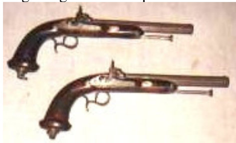
Två Ronge-pistoler fotograferade i Frankrike