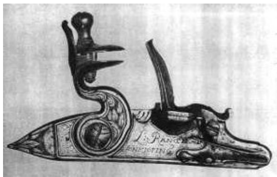
Detalj av pistol på Jönköpings Museum

För egen del har jag i en antikaffär köpt en Rongepistol av senare datum, gissningsvis från 1800-talet. Den är tydligt märkt med namnet RONGE. Dess historia skulle vara intressant att få veta.